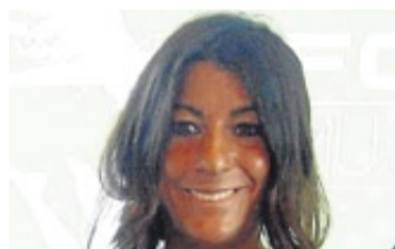
Sheila Herrero CAMPEONA DEL MUNDO DE PATINAJE